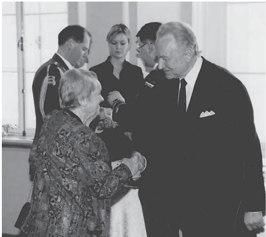
Nejvyšší estonské vyznamenání, řád Maarjamaa Risti, převzala překladatelka v roce 2004 z rukou prezidenta Arnolda Rüütela