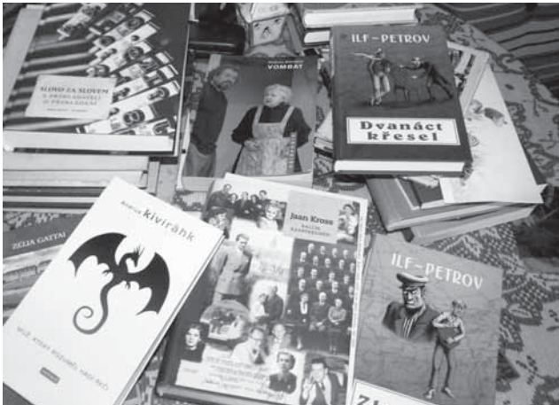
Z knih, které Naděžda Slabihoudová dosud z estonštiny přeložila, je možné vyskládat úctyhodnou a také reprezentativní hromádku