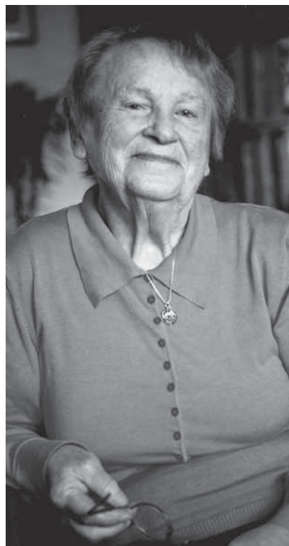
90 let by paní Nadě asi nikdo nehádal

Bohužel je to tak, s tím asi nic nenačláme. Třeba se k nám ale estonská literatura nakonec dostane oklikou z jiných částí světa. Estonská literatura se dnes překládá do finštiny, švédštiny, norštiny, dánštiny, francouzštiny, němčiny, angličtiny. Jen u nás téměř žádný zájem. Estonsko je malá země a my dáváme přednost